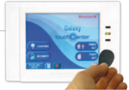
Snel en veilig in- en uitschakelen met pincode