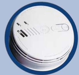
Ei 166 RC